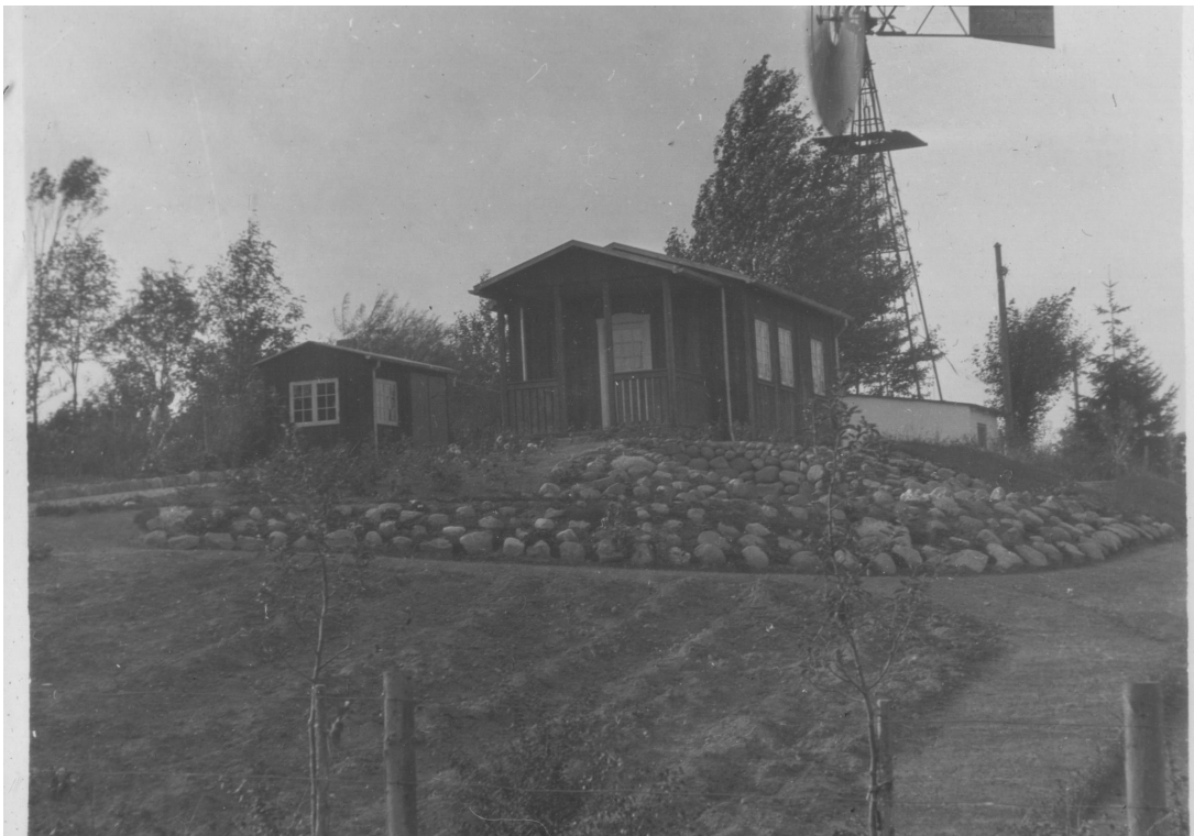
Vandværkets vindmølle 1930. Overfor kirken.

Forud for aktieselskabet start i 1921 leverede interessentskabet Hareskov Villaby's Vandværk vand fra en brønd med en pumpe betjent af en vindmølle. Men Hareskov Villaby's Grundejer og Borgerforening var interesseret i at overtage vandforsyningen og fik i 1920 kommunegaranti på 35.000 til nyt vand anlæg.