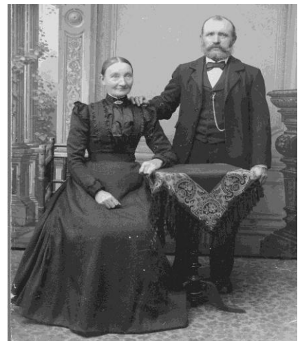
Farmor og farfar som vi boede hos i 2 år