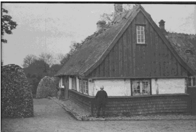
Glasbankehuset, Køge 1919

Så omkring august 1919 flyttede jeg skole igen, stadig i 3. klasse. Det blev på Brochmanns Skole i Køge denne gang. Vi boede hos min farfar og farmor de første 2 år før mor endelig fik en lille 2 vær. lejlighed i Nyportstræde nr. 37 over gården. Det var lige så vanskeligt dengang som nu at få noget at bo i, det var jo lige efter den første verdenskrig, der varede fra 1914-1918 og vi kom til Køge 1919.