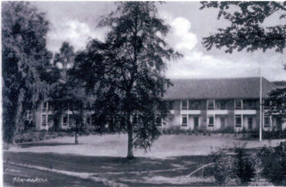
Mine forældre gik på pension 1950 og flyttede ned i Aldersrenten på Poppel Alle.